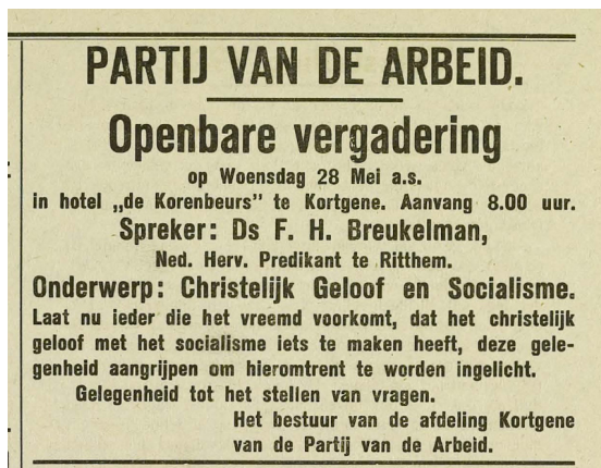
Afbeelding 2. Advertentie bijeenkomst Partij van de Arbeid (1947)