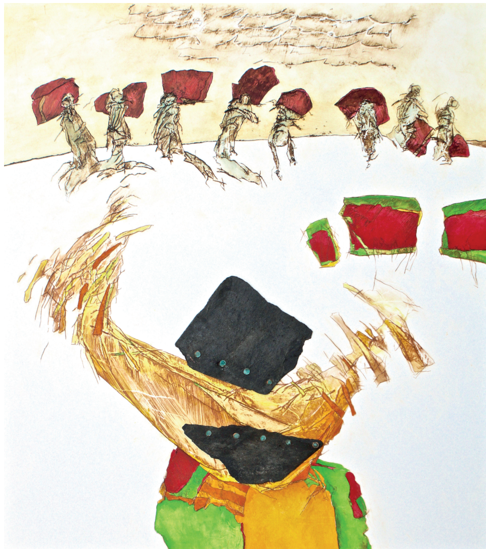
acryl en gemengde techniek op paneel | 20,5 x 27,5 cm