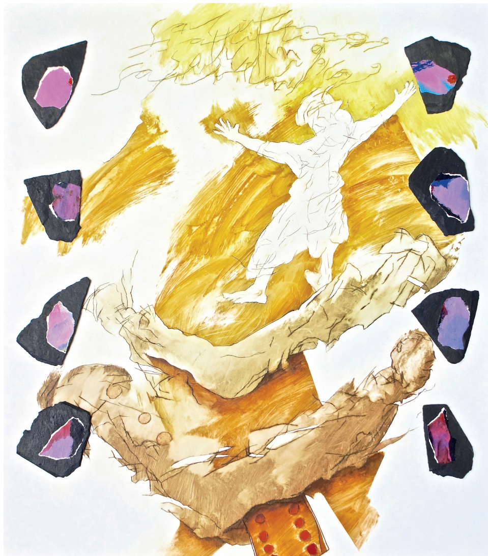
acryl en gemengde techniek op paneel | 79 x 70 cm